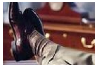
Business-Knigge Der erste Eindruck zählt