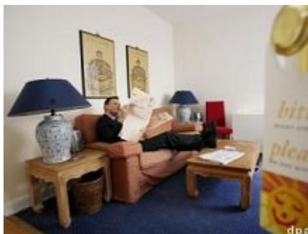
Der Mieter muss sich um nichts kümmern.