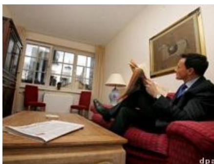
Derzeit gibt es rund 5000 Wohnungen mit Komplettservice in Deutschland.